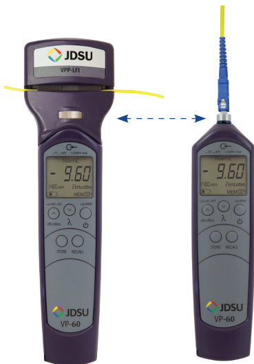
Идентификатор активного волокна